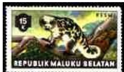
Serie correo Oficial

Son 8 valores de la serie de 1953 de animales, catalogados número 1 al 8., llevan la leyenda RESMI