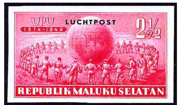
Primera serie aérea

Correo aéreo 6 valores de la serie de romboidales de los pájaros, números 9 al 14.