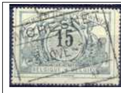
Marca estación ferroviaria