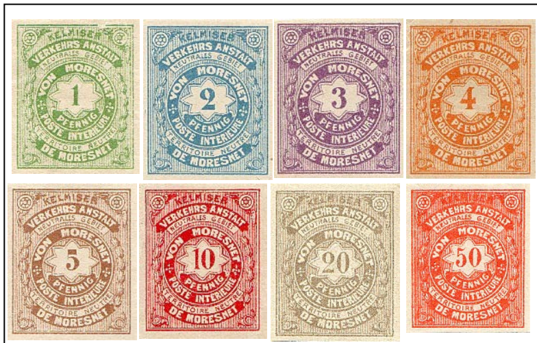
Emisión de Moresnet editada, prohibida y retirada en 1886

Sus marcas postales llevan las marcas de Montzen, Calamine, Moresnet y Neu Moresnet.