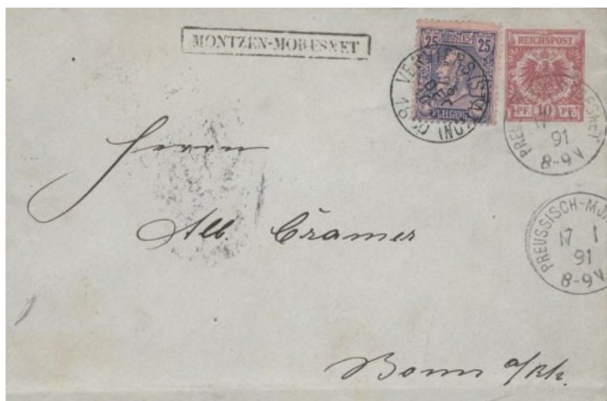
Carta circulada de Montzen – Moresnet, con marca de Moresnet prusiano (preussisch – Moresnet) 1891

El propio Dr. Molly, propuso al territorio de Moresnet, como el primer estado de habla de Esperanto en el año 1908.