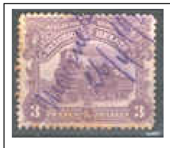
Marca de fortuna manuscrita

Su principal riqueza fueron las minas de cinc, pero estas se agotaron en el año 1885.