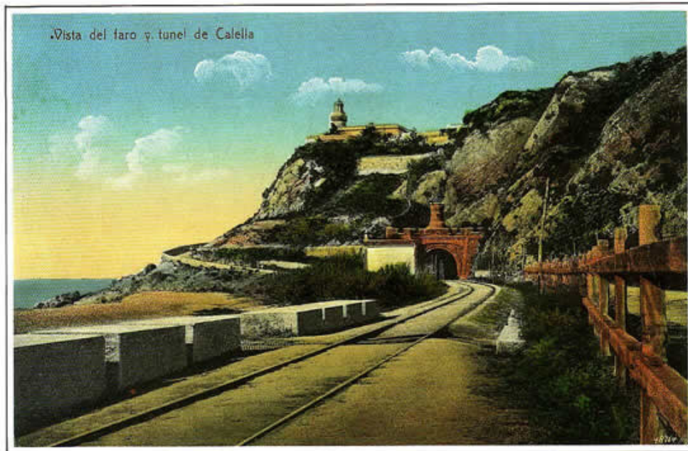
"EL FAR DE CALELLA" (Fotografia de 1914)

Ara, que sota el mantell de la nit, —bordat de perles i brillants estrelles— Calella acluca el somni les parpelles, el Far, dalt d'un turó, la llum ha eixit, I vetlla del Montnegre a l'infinit, guaitant amb els seus dolls per les clivelles, juntament amb la lluna i les roselles, com als seus peus, Calella s'ha adormit.